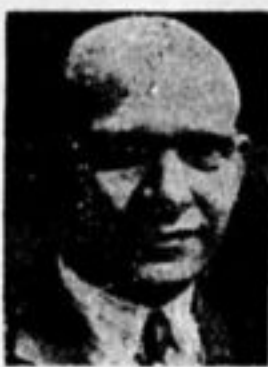
Т. Тельман, кандидат немецкой компартии в президенты Германии.