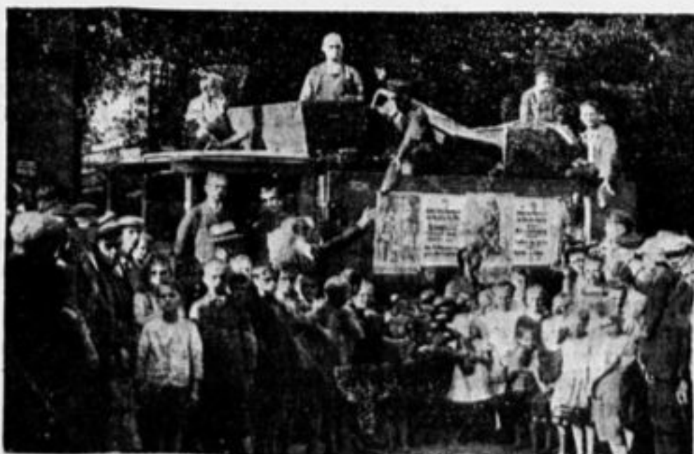
Межрабпом раздает нуждающимся детям рабочих подарки, купленные на деньги, собранные рабочими и всех стран.