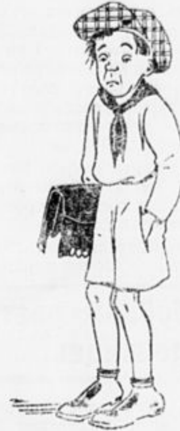
Это Петя Недотыпкин. Ноги спички, руки тряпки. На уроках мух считает. Шесть раз в сутки спешаает; Ну, и смена!